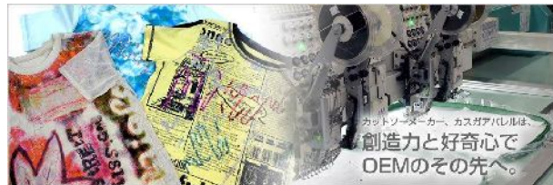
カスガアパレル株式会社