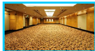
ウィルトンカーペット